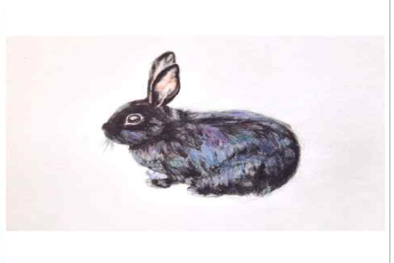
그리고 운명인지 우연인지 2006년 여 양이와 황진이랑 너무 달은거 있지...