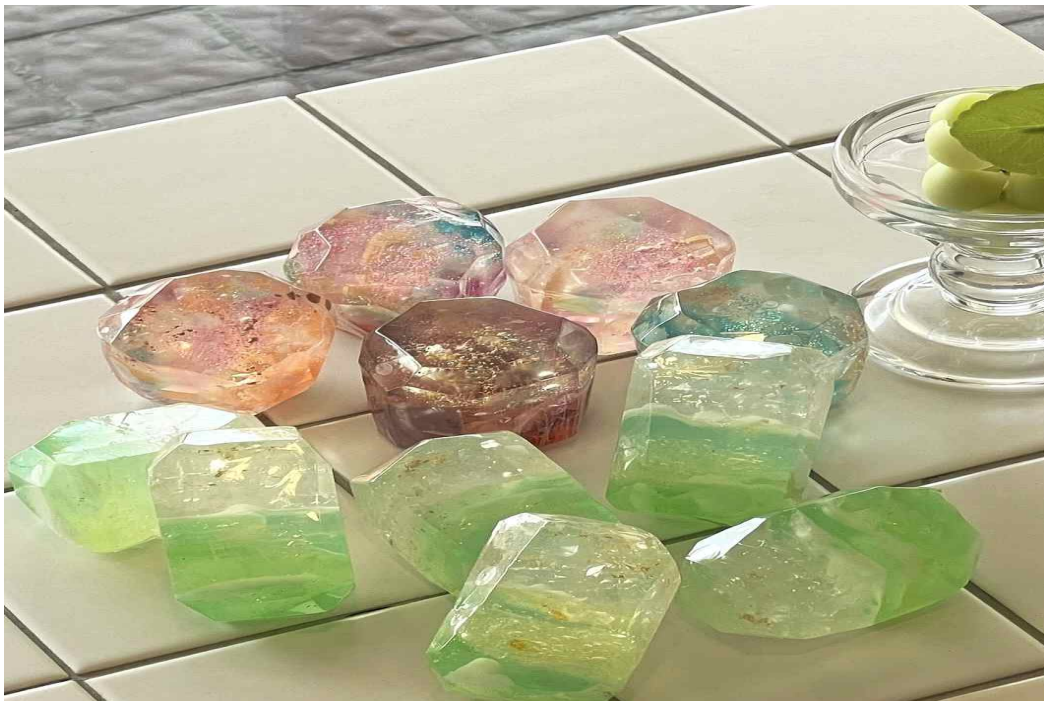
[ 보석비누 ]