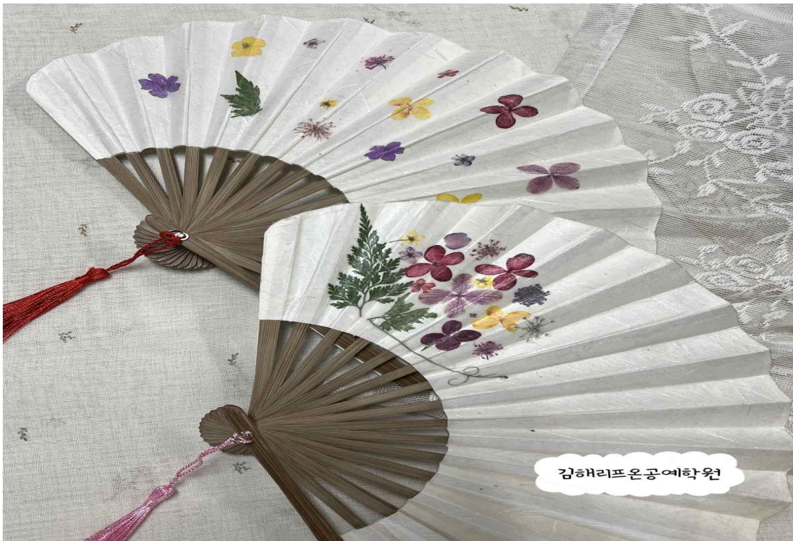
[ 압화부채 ]